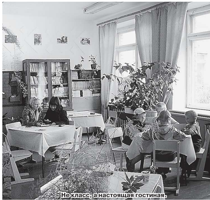
Не класс, а настоящая гостиная.