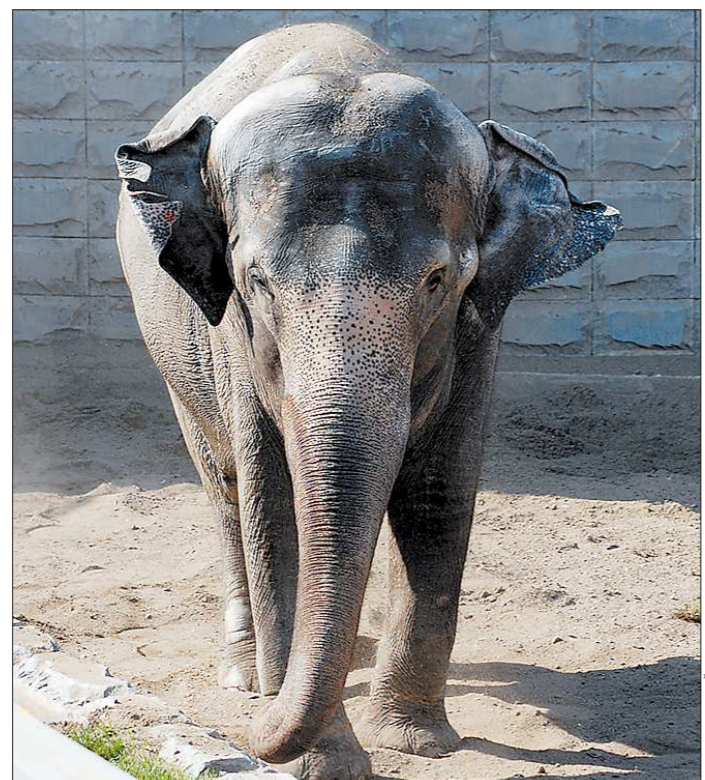
Даже после ухода из цирка Даша осталась звездой

Разделить форматы – хорошая идея. На нашем фестивале и основная, и «альтернативная» сцены – акустические. Это – правило. Оно продиктовано нашим нежеланием идти за формой и «фонограммно-барабанным боем». Понятно, что слушать бардов приезжают в основном люди старшего поколения, а молодежь ближе музыкальная составляющая. Но, предлагая авторам песен только акустический формат самовыражения, мы стараемся на первое место ставить именно Песню, как это понимается в бардовском мире, и в мире Авторской песни. И, приняв наши правила, «альтернативщики» со временем понимают, что все мы делаем одно дело – украшаем, разнообразим и наполняем смыслом человеческую жизнь.