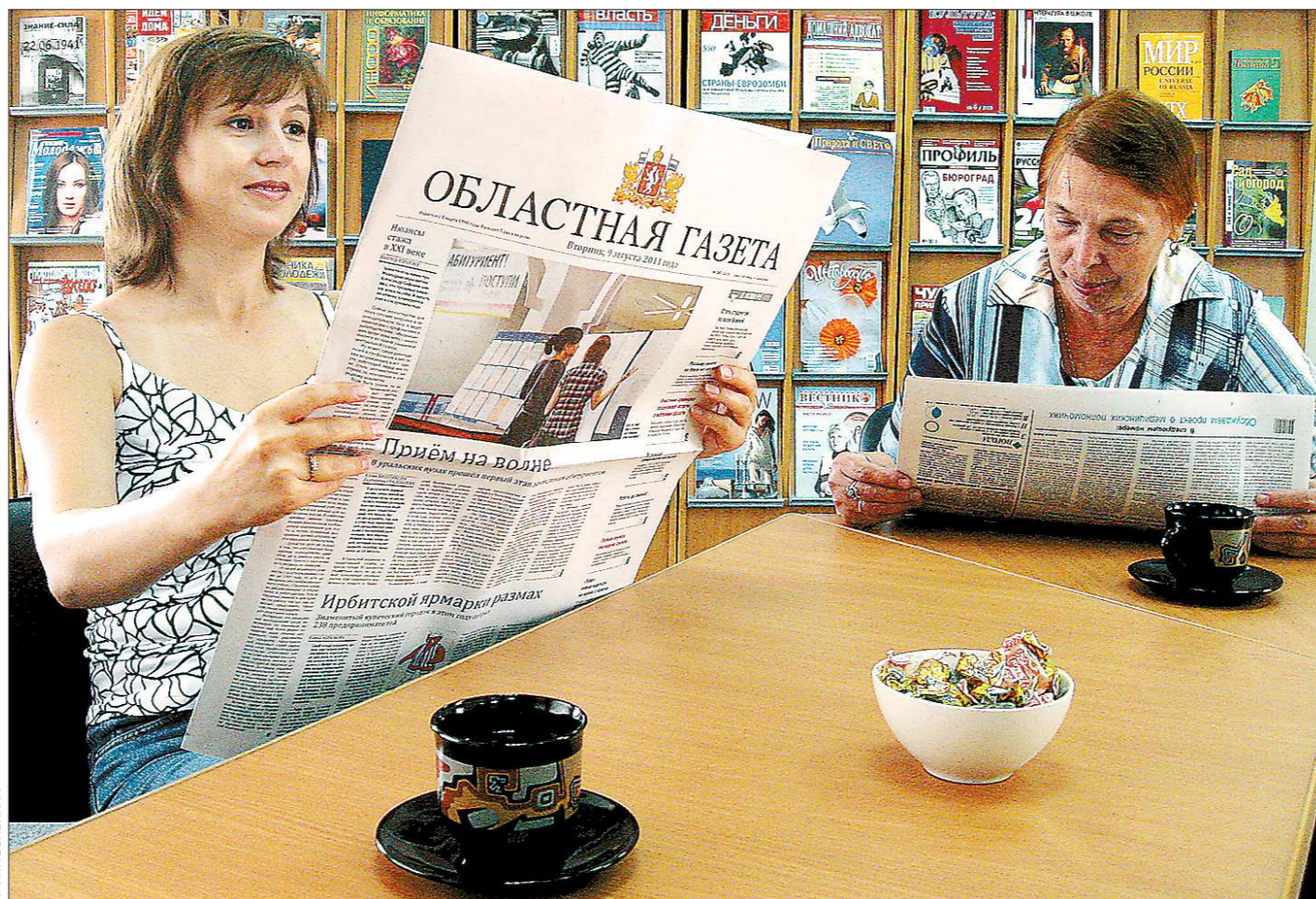
Хорошее утро должно начинаться с чашечки хорошего чая. И – с хорошей газеты

«Пуэр, улун, земляничный, те гаун нин, молочный. Это уже следующий зал. Здесь хранят»...отчётливо ощущается в Музее истории камнерезного и