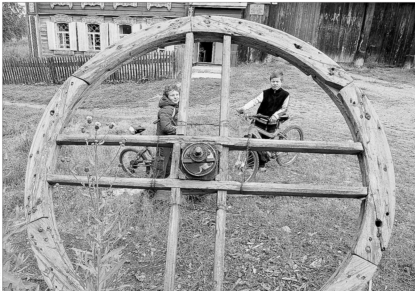
Это колесо недавно стояло на «Малахитовом». Теперь оно – музейный экспонат

Лидером по оказанию населению почтовых услуг остаётся Екатеринбургский почтамт, доходы которого составляют треть от доходов всей сети почтовой связи в области. Хорошие показатели развития услуг почтовой связи отмечены также в Нижнетагильском и Новоуральском почтамтах. Финансовые услуги на почте пользуются наибольшей популярностью среди жителей Камышловского района.