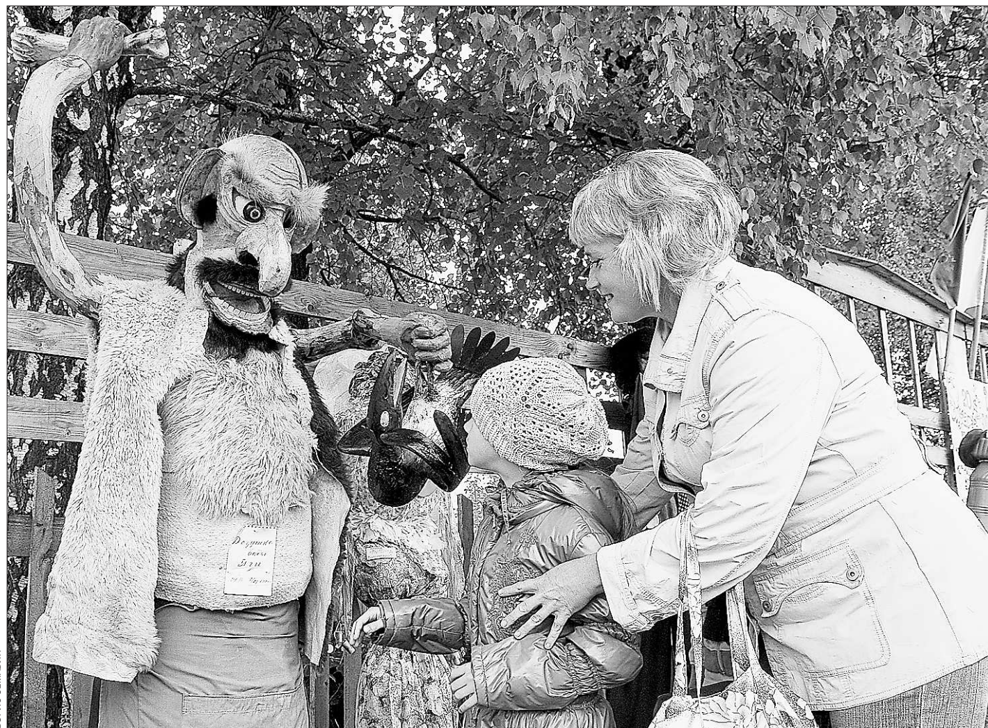
На выставке пугал висимцы шутили, что вороны не только не рискнут попробовать свежий урожай, но и вернут прошлогодний