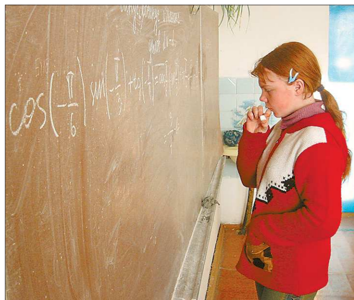
Основные средства поступившие в область из федеральной казны направляются на модернизацию образования

№ 309 (5862). Цена в розницу — свободная.