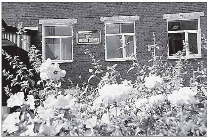
«Красная Шапочка» — шахта-ветеран

Под глухими сводами шахты Александр Сергеевич пообщался с рабочими и с большим интересом наблюдал, как действуют новые шведские дистанционные управляемые машины. Они заменили на СУБРе своих устаревших физически и морально предшественников. И оказались просто незаменимыми в таких забоях, где