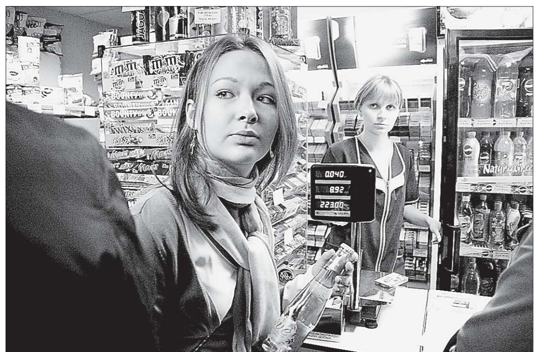
Сигареты и алкоголь доступны подросткам

Очередной рейд по торговым точкам провели активисты Екатеринбургa: алкоголь и сигареты отпустили несовершеннолетнему в первом же магазине