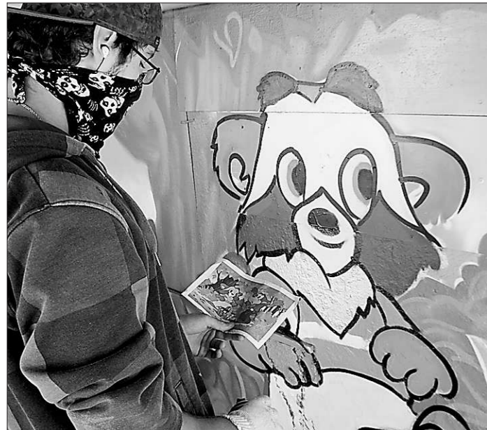
В детсаду «Сказка» теперь даже веранды стали сказочными