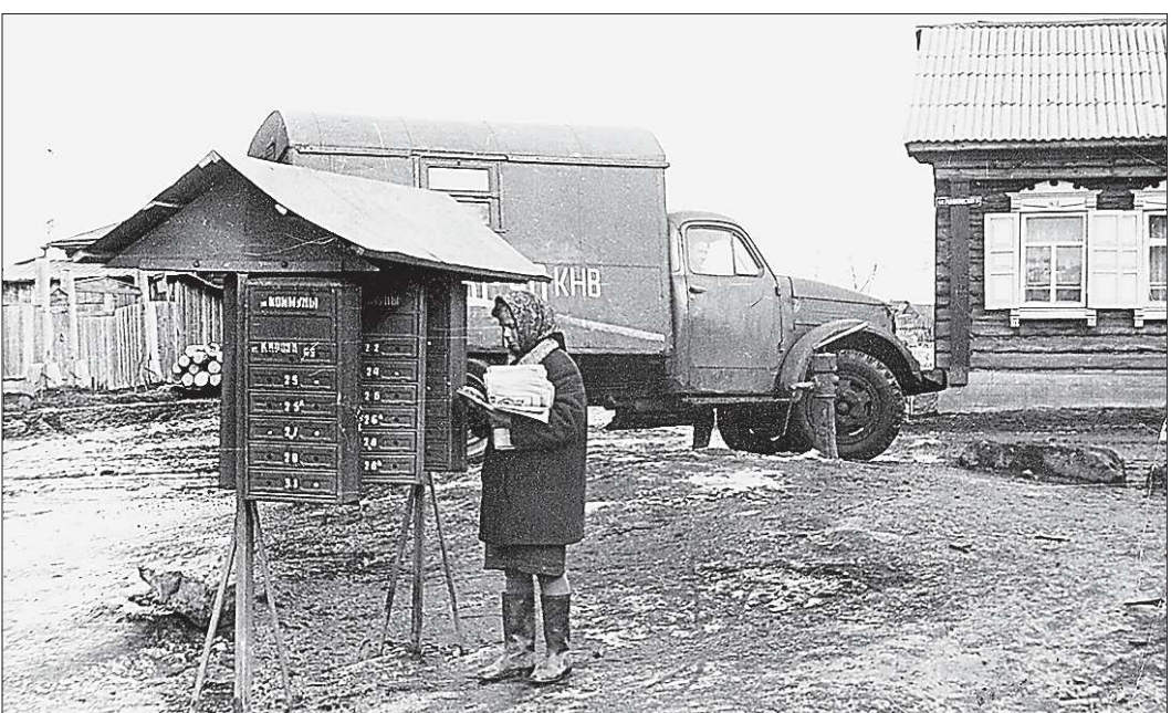
С 1970-х труд почтальонов в иных местах мало в чём изменился, но почту они доставят при любой погоде и в любой уголок области

Итоги подписной кампании в целом по России свидетельствуют о том, что половина россиян остаётся верна печатным СМИ. Несмотря на развитие сетевых ресурсов, существование электронных версий большинства периодических изданий и экспансию планшетников, более 30 миллионов экземпляров газет и журналов доставит Почта России подписчикам во втором полугодии текущего года.