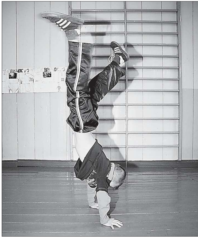
С ног на голову – уроки физкультуры модернизируют