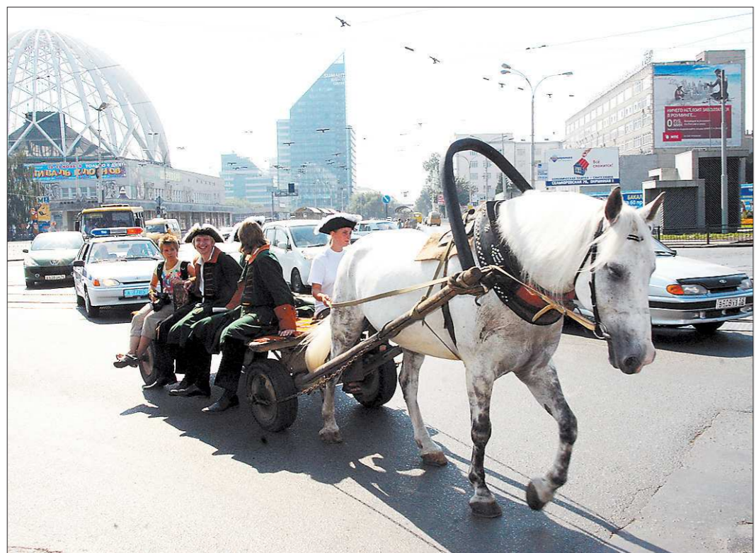
Тeatрализованная акция открыла череду мероприятий празднования Дня города