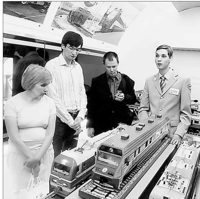
Уже в первый день работы передвижного комплекса в выставочных вагонах было тесно