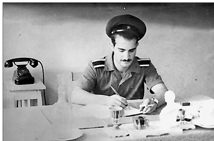
Курсант в наряде (1960–63 гг.).

мую низкую цену путёвки, и приоритет отдаётся цене. Это же глупость! Пока не примут по этому закону кардинальные меры, у нас так и будут детей и взрослых травить в детских садах, лагерях и санаториях.