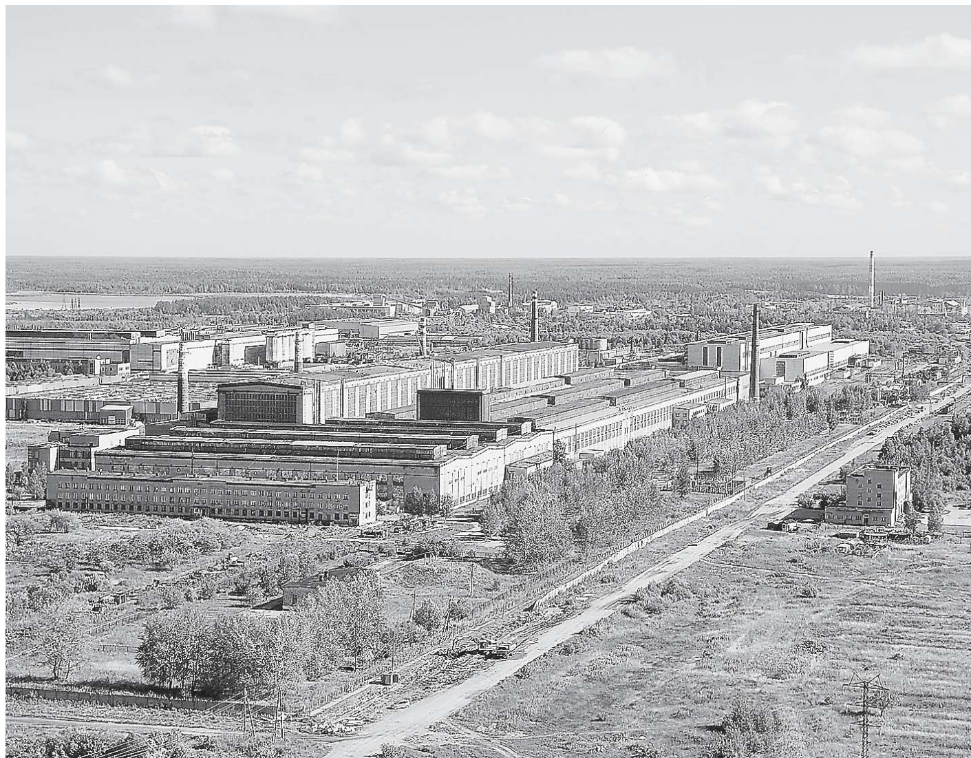
Титановый стержень долины ВСМПО-АВИСМА, вид сегодня

Львиная доля расходов на возведение инфраструктурных объектов — 10,7 миллиарда рублей — потребует на возведение объектов энергоснабжения. Ещё в 5,1 миллиарда рублей обойдутся автомобильные дороги, 2,5 миллиарда рублей — железнодорожные пути. Остальные средства уйдут на прокладку остальных инженерных коммуни-