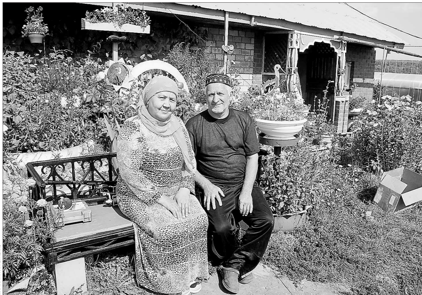
Красивая семейная пара в чудо-саду