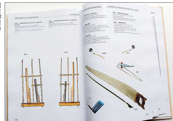
Этот же инструмент на странице каталога