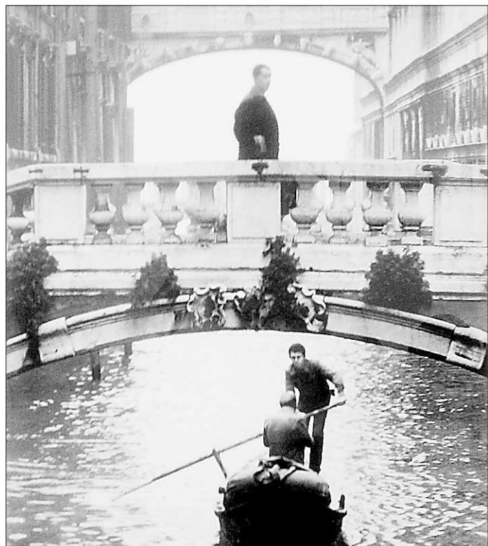
Вечная вода Венеции