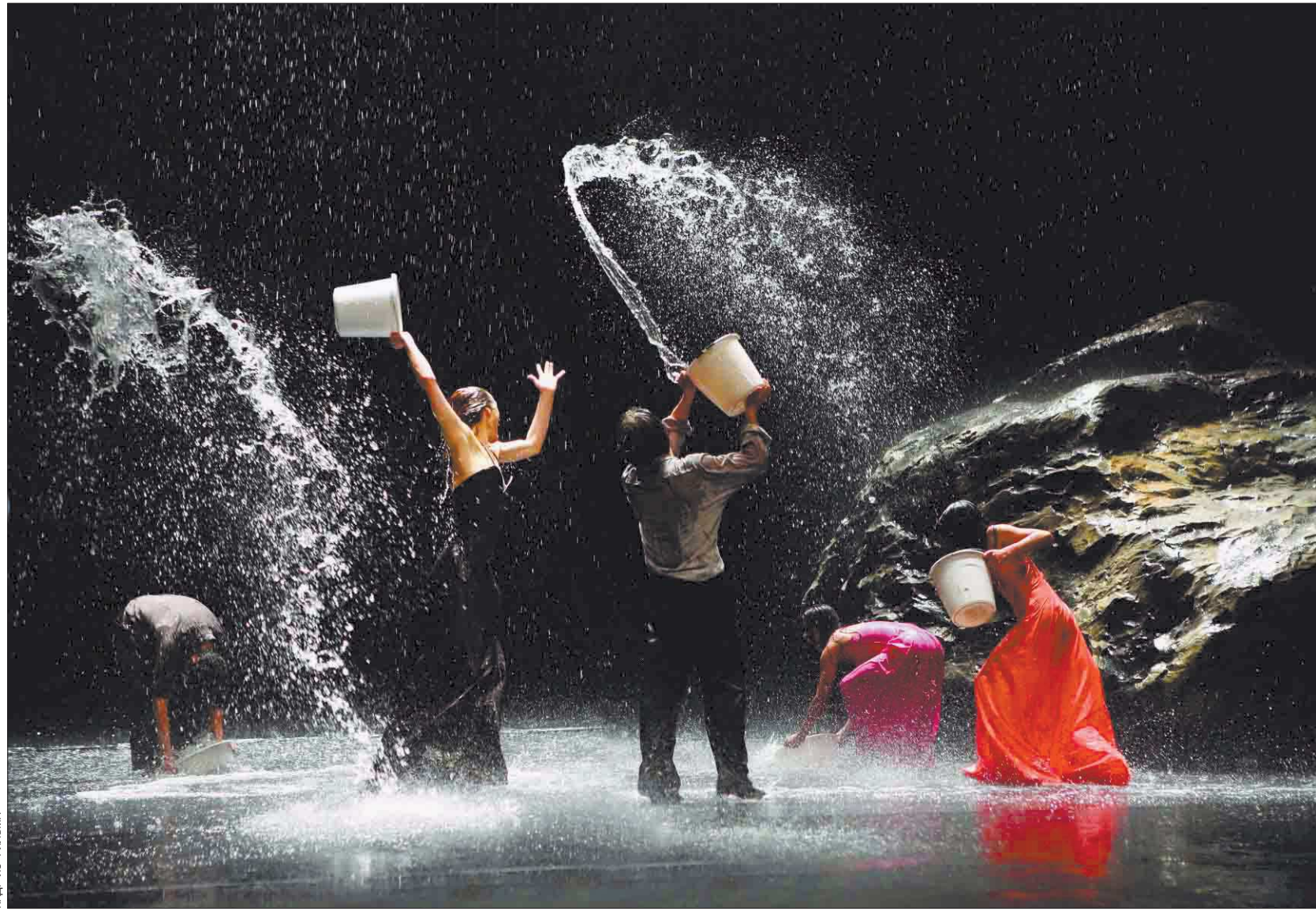
Сошлись три стихии: вода, воздух, огонь. Огонь страсти

– Цветы безвозмездно дарят окружающим свою уникальную красоту, они приносят в жизнь цвет, улыбки, счастье. Я стараюсь запечатлеть эту красоту и поделиться ею со зрителями, – говорит девочка. Драматизм в том, что для школьницы Екатеринбургской «Цветочная сказка» – способ победить тяжёлый недуг. Первая персональная фотовыставка Катерины проходит в рамках благотворительной акции библиотеки «Лето – время Творить Добро». Присоединяйтесь: прикоснитесь к «Цветочной сказке».