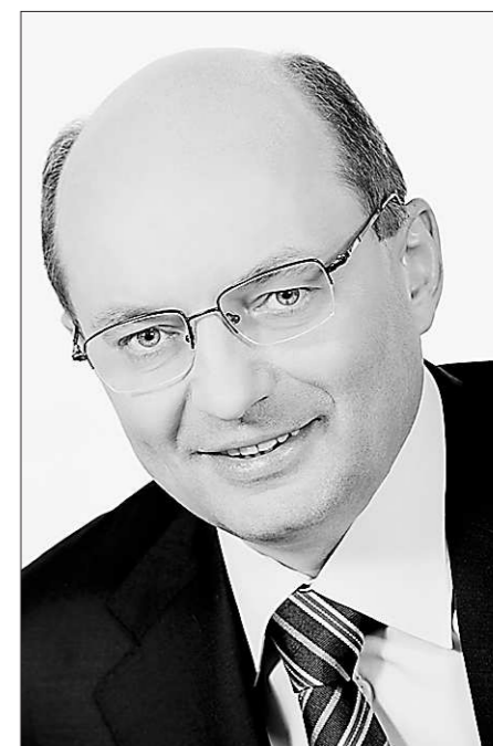
Александр МИШАРИН, губернатор Свердловской области