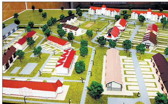
Светлореченский готов к новосельям

В этом экспериментальном посёлке всё радует глаз — и ландшафтный дизайн, и просторные детские и спортивные площадки, и оборудованная стоянка для авто, и даже специальные места для выгула домашних животных. А каждый из таунхаусов — индивидуален. Это вистину жилой, а не просто спальный район. В одном из домов сделано даже невидимое отопление — тепловые панели, создающие осо-