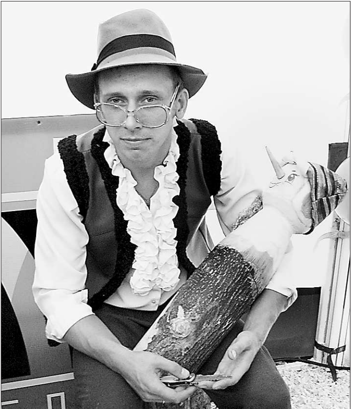
«Папа Карло» из города Лесного доказывал, что лучшая мебель — та, что сделана на Урале