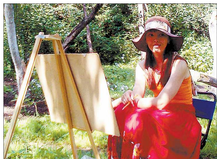
Сад Казанцева сохранил аромат Екатеринбурга XIX века. Надолго?

Здесь и сейчас саду помогают студенты и преподаватели Горного университета. И не