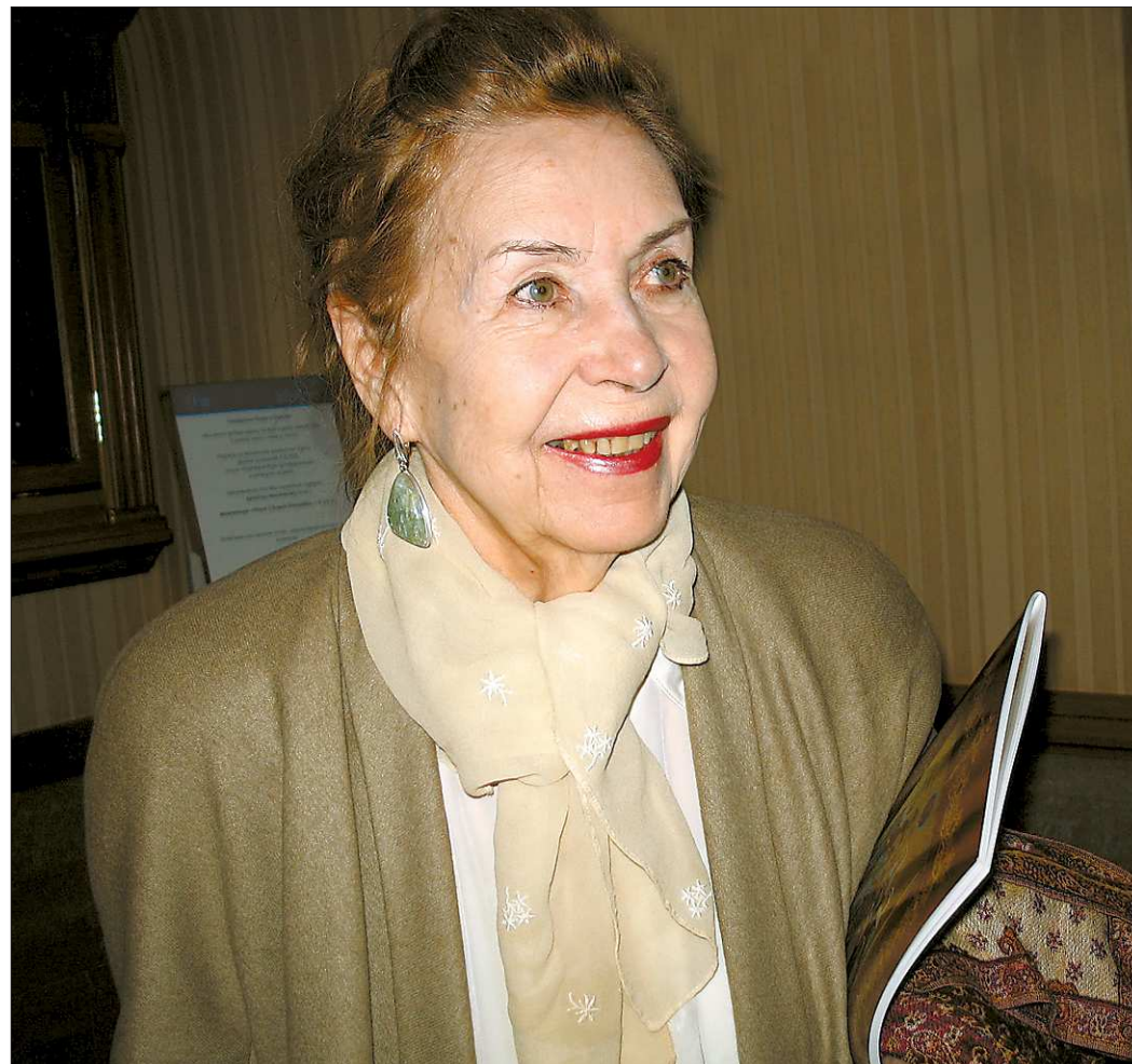
Народная артистка СССР Инна Макарова: «Чего ещё мне ждать от кино, после того как я снималась у Герасимова, Зархи, Хейфеца, Пудовкина?»

— Знаете, с героями «Молодой гвардии» мы столкнулись сначала в качестве актёрских этюдов на курсе Сергея Герасимова во ВГИКе. И распределение ролей первоначально было иным. Ульяну Громову, например, играла Олеся Иванова, обладавшая красивым грудным голосом. Она и предложила (для обогаще-