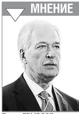
Борис ГРЫЗЛОВ, председатель Государственной Думы