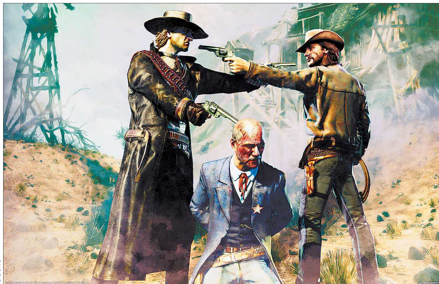
«Разоружая народ, власти оскорбляют его недоверием». Никколо Макиавелли