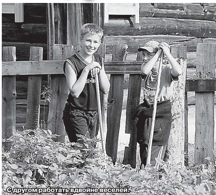
С другим работать вдвойне веселей.