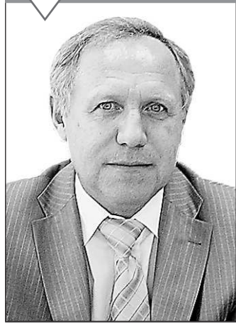
Валерий ТУРЛАЕВ, первый заместитель министра промышленности и науки Свердловской области