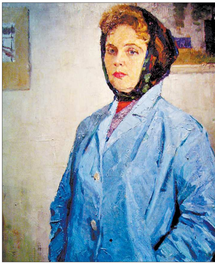
Портрет жены художника

лую жизнь оставался верным его красоте, его истории, его людям. Начав его познание со съёмки документального фильма «Нетронутый Урал»,