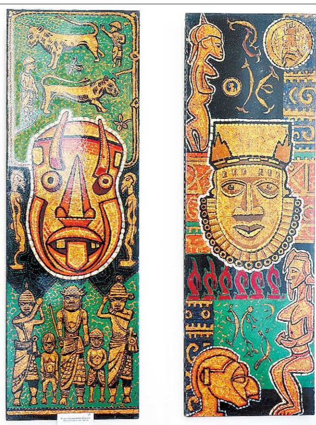
Иконы времени. На них молились разные народы

куда его пригласили главным художником. Фильм не вышел по разным причинам, но молодой живописец-таки увидел этот край свежим, по-