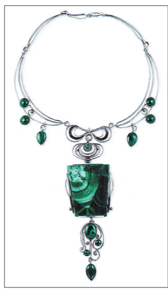
Малахитовое ожерелье «Серебряная ночь»

Он использовал не только природную красоту камня: умел обработать его порою в достоинство. Однажды на-