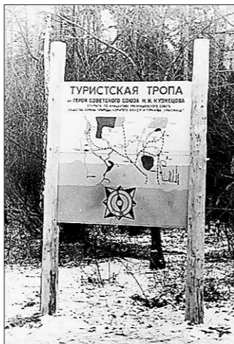
Указатель на тропе: с пути не сойдёшься

Тропа начинается на Уралмаше у памятника Николаю Кузнецову (в конце бульвара Культуры). Основным ориентиром для направления движения по тропе служит Белая башня за бывшим Дворцом культуры Уралмашзавода. Тропа, маркированная звездой Героя (на деревьях или столбах), пересечёт бывшую танковую дорогу (построена