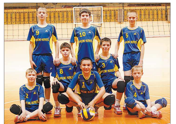
Юные волейболисты из Режа обыграли всех своих сверстников