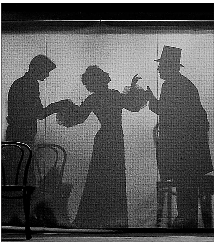
В тизовой постановке игру от реальной жизни отличить порой невозможно

Все играют! Кто на скрипке, кто на сцене, все вместе – на нервах зрителе-