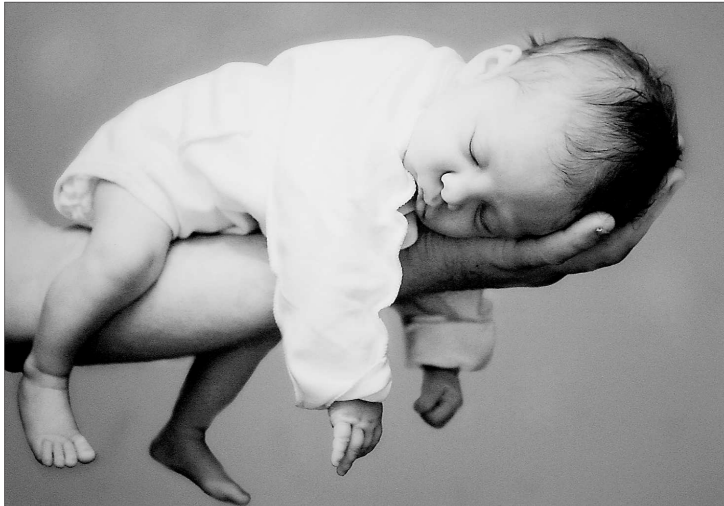
Одна из работ Анастасии Софрыгиной – «Вероника. 8 дней. На руке у папы спит хорошо»

6 июня соперники проведут третий матч серии в Екатеринбурге (ДИВС, 19.00).