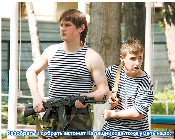
Разобрать и собрать автомат Калашникова тоже уметь надо.