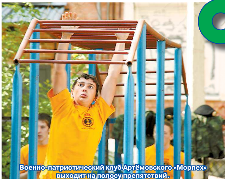
Военно-патриотический клуб Артёмовского «Морпех» выходит на полосу препятствий.