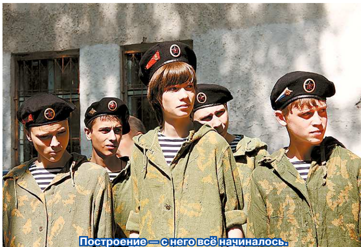
Построение – с него всё начиналось.