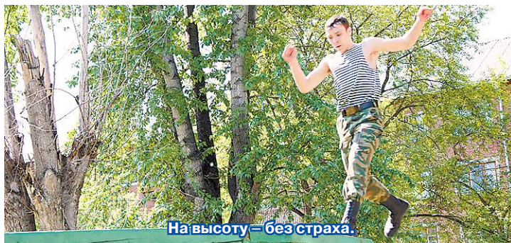
На высоту – без страха.

Спецвыпуск «Областной газеты» – «Новая Эра» для детей и подростков. Выходит с апреля 2000 года. Сегодня вы прочитали выпуск № 535. Следующий номер выйдет 18 июня. Пишите! Звоните! Адрес редакции: 620004, г. Екатеринбург, ул. Малышева, 101. «Областная газета» – «Новая Эра». Тел.: (343) 375-80-33; тел. и факс 374-57-35. pe@oblgazeta.ru