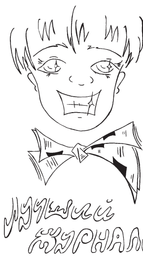
Рисунок Ольги БРЫНЦЕВОЙ

На награждение приехали юные корреспонденты из 20 населённых пунктов Свердловской области. Далеко не все хотят связать свою будущую профессию с журна-