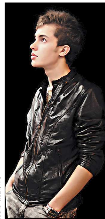
В кого бы перевоплотиться?

Удивительной способностью перевоплощаться из Пугачёвой в Моисеева, из Баско-