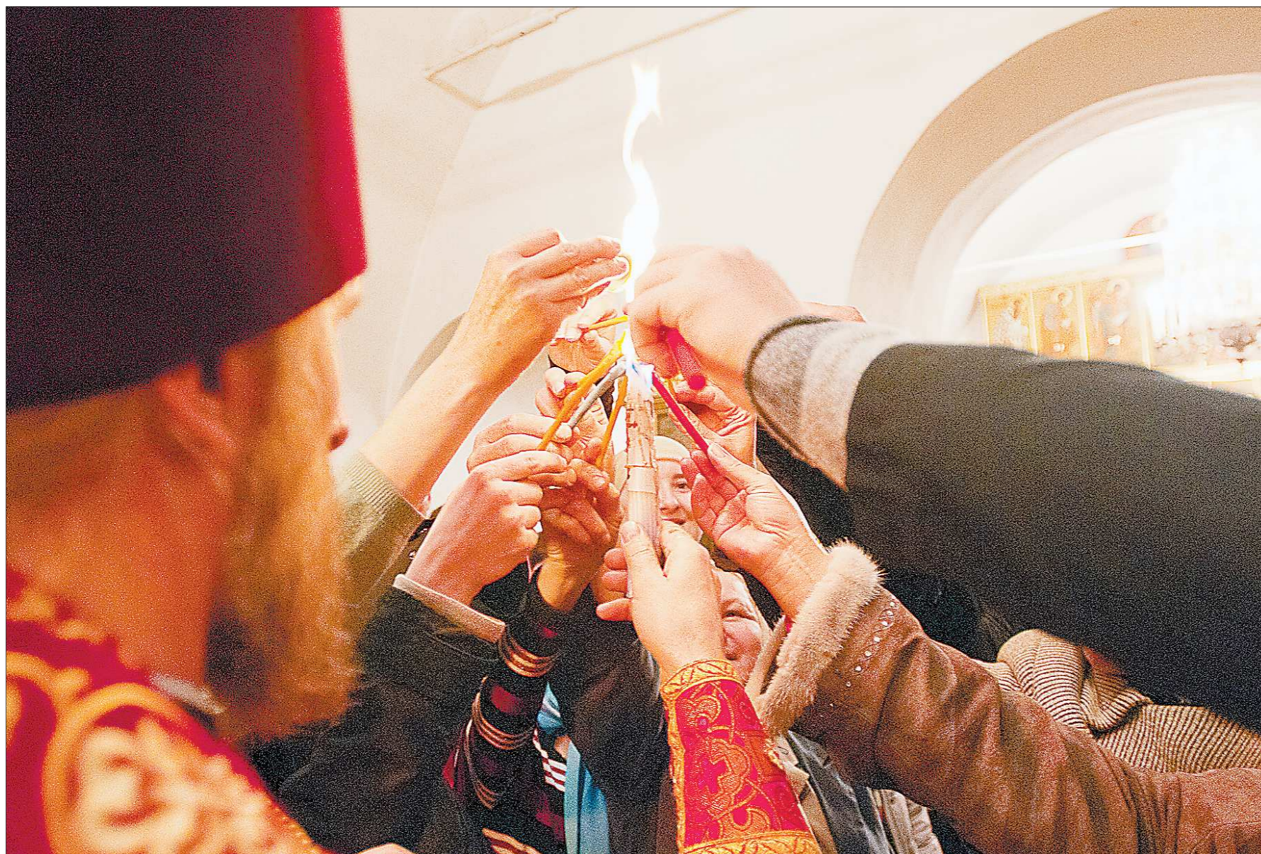
От Благодатного Огня будут зажжены лампы по всему Иерусалиму, а оттуда — по всему миру.