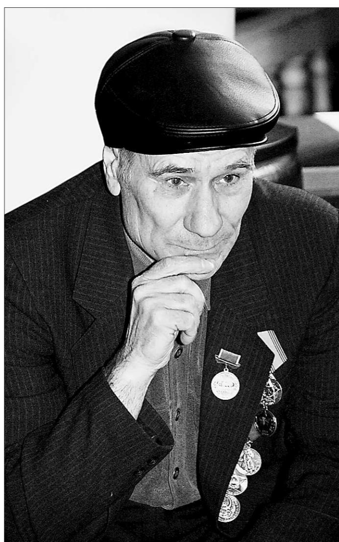
Пережитое остаётся с этими людьми на всю оставшуюся жизнь.

Вчера в Свердловской области почтили память жертв, пострадавших в нацистских и сталинских лагерях