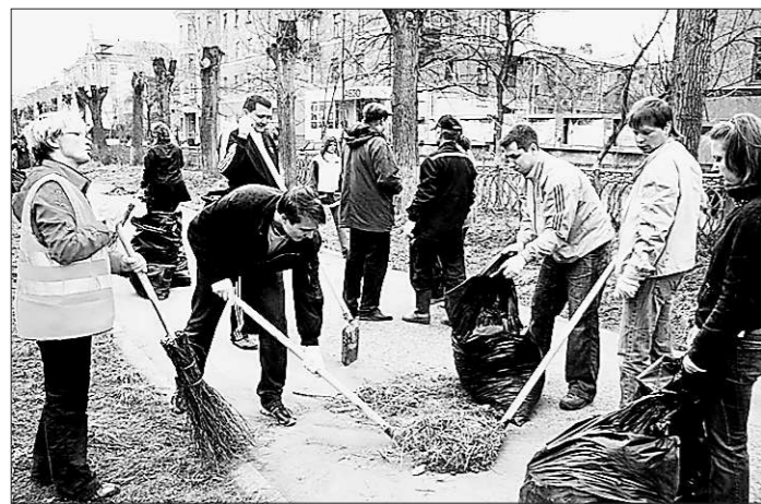
Субботник — дело грязное, но нужное.