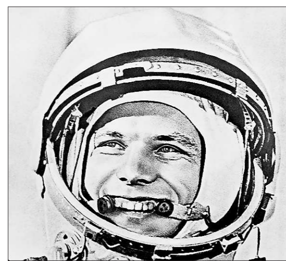
12 апреля 1961 года. Юрий Гагарин перед стартом.

Владимир Комаров, испытывавший корабль «Союз-1»