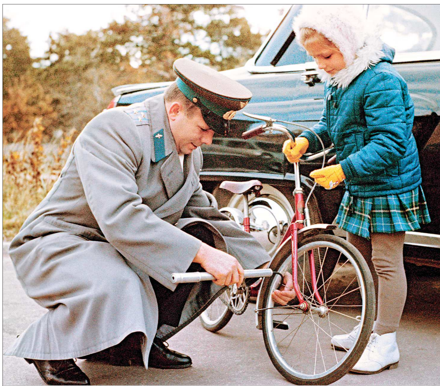
1966 год. Юрий Гагарин с дочкой Леной на прогулке. Сегодня Елена Гагарина — генеральный директор Государственного историко-культурного музея-заповедника «Московский Кремль».

В России есть праздники, первопричины и названия которых ясны, увя, далеко не всем соотечественникам. Не следует, наверное, принижать значимость событий, лежащих в их основе. Но 12 апреля... На снимках мы видим ликующие толпы, заполнившие московские улицы. Счастливые лица скромно одетых людей... Вряд ли нужно делать 12 апреля красным днём календаря?