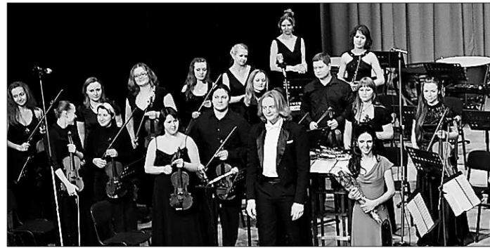
«Ожидание» — позади. Впереди — ожидание нового Концерта.

— Одно время было. И я переносил себя в балалаечника. Балалаечник — человек, исполняющий традиционный народный репертуар или классику. Балалайщик более свободен: он исполняет то, что у него на душе. Я играю то, что мне снится. Сны такие музыкальные вижу с детства. Просто сейчас, спустя годы, им стало проще воплотить в звуки.