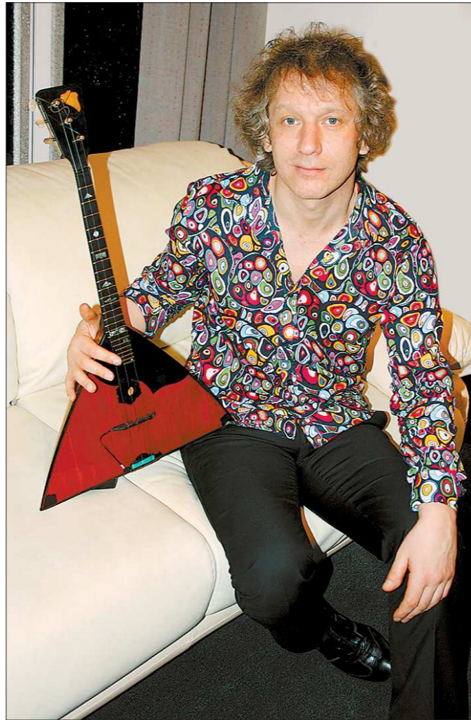
Балалайка — больше, чем друг.

— Только в детстве. Вопросы «Чем я занимаюсь?», «Почему балалайка, а не гитара?» — я задавал в музыкальной школе. Тогда меня привели родители (учился на двух специальностях: фортепиано и балалайка). Я был послушным мальчиком, однако мальчишки, осваивающие балалайку, встречались редко, и я испытывал настоящий комплекс