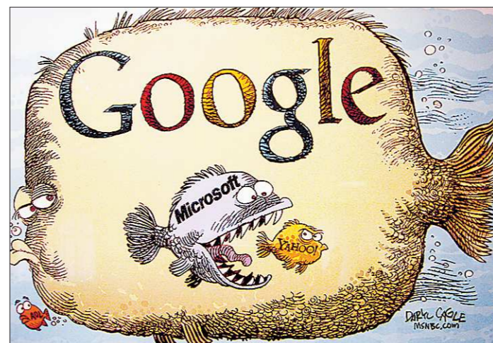
Рисунок Дэрила Кэйгла

Наш ответ Кэйглу — работы Анатолия Гилёва и Джона Кудрявцева. Последний творчески отделился в борьбе с главным советским врагом — американским империализмом. В 70-80-е годы сатирические карикатуры были частью идеологической пропаганды. Сегодня воспринимаются как искромётные и точные заметки замечательного художника. Рисунки Анатолия Гилёва, патриарха отечественной карикату-