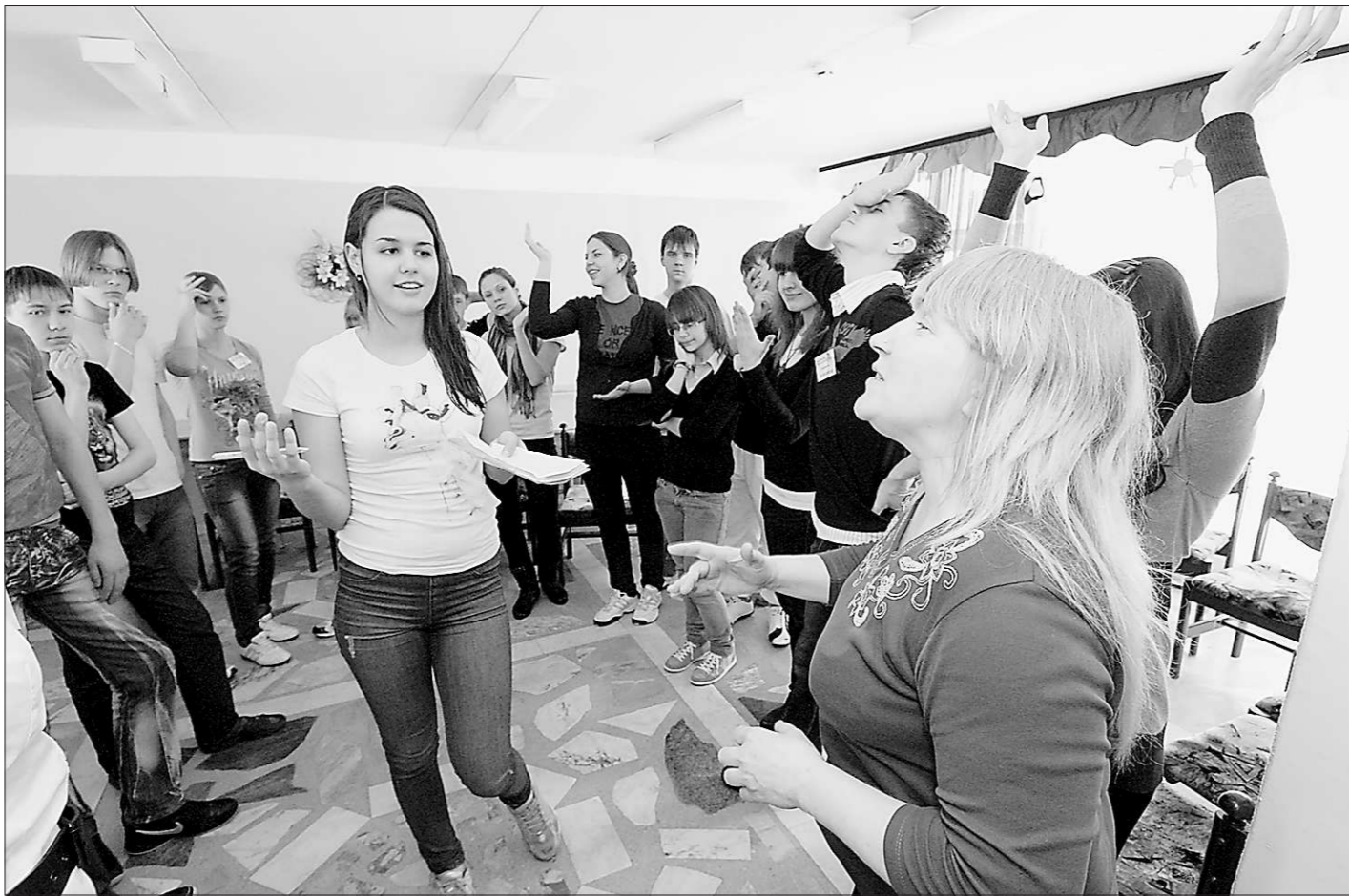
Это не дискотека! Вместо отдыха участники школы старательно репетируют свою презентацию.