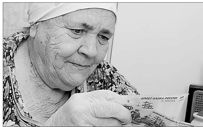
Прибавка – ошущима.