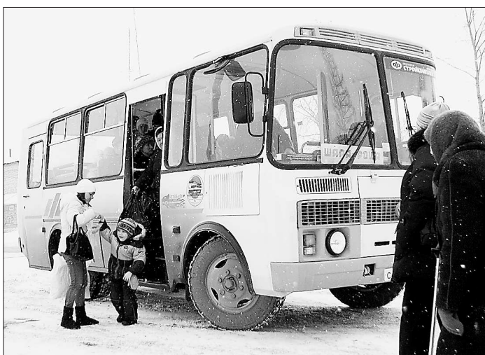
На автобусе надёжней.

Корреспондент «ОГ» проследовал на муниципальном автотранспорте по маршруту: Шаля-Шамары-Платонов-Роца и убедился, что пассажиры с детьми и прочие осторожные граждане предпочитают путешествовать в автобусах. Но тот, кто хотел доехать быстрее и чуть дешевле – прыгал в попутку. Набирая пассажиров, хозяин легковушки брал с них на десять рублей меньше, чем водитель автобуса. А тот взимал пла-