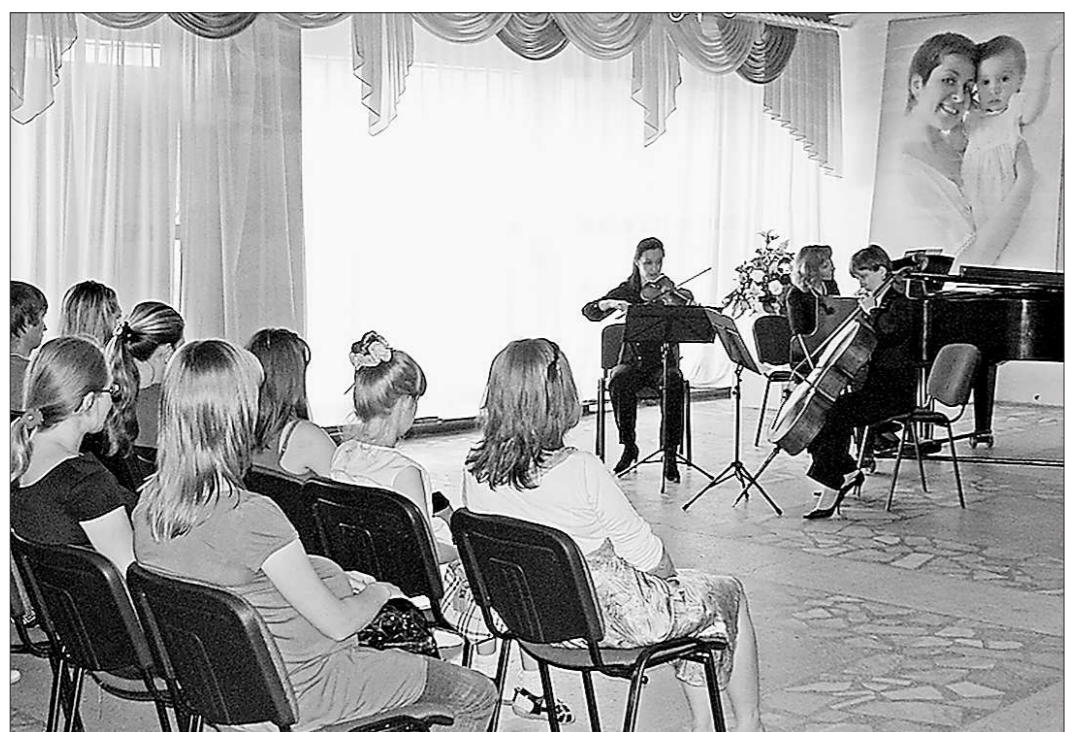
Каждая из слушательниц получает двойное удовольствие!