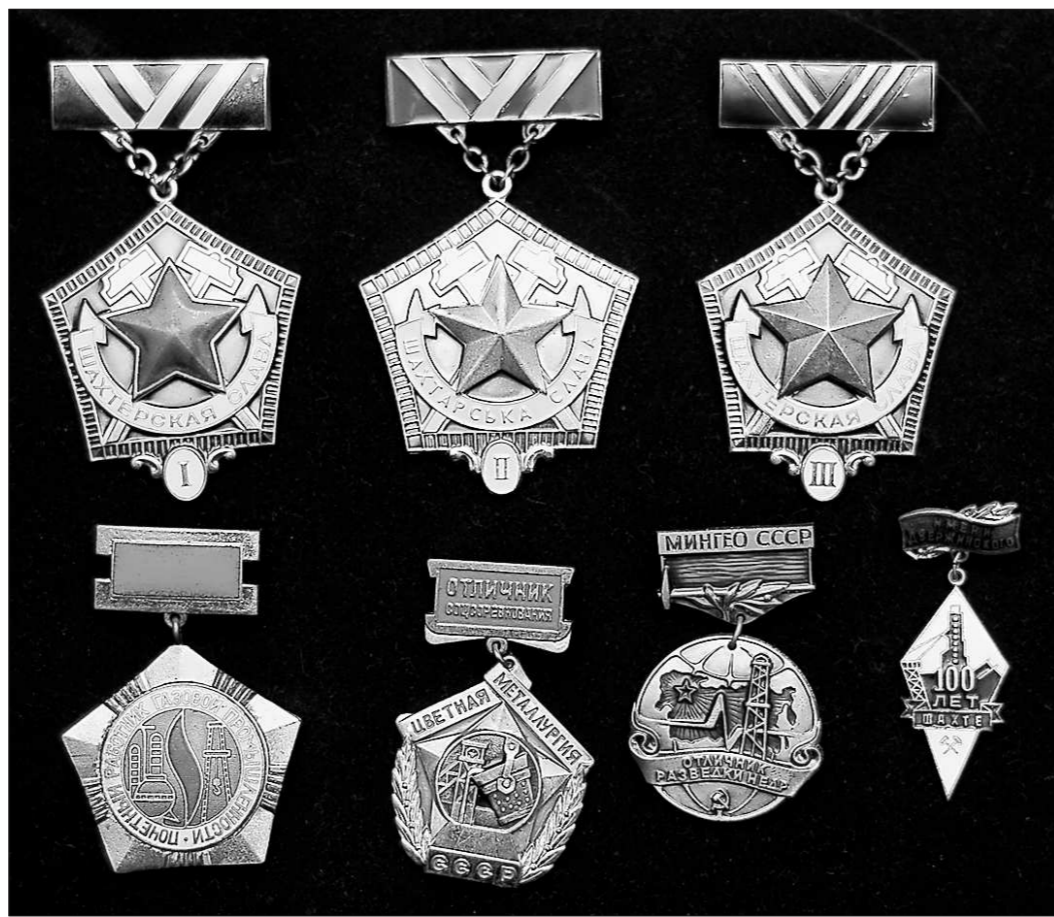
Экземпляры из подаренной Уральскому геологическому музею коллекции.

Язык и стиль печатных изданий Г. Уфимцева подчёркивают не только неисчерпаемую глубину знаний и остроту ума учёного-геолога, но и его жизненный оптимизм, которым он щедро делится с читателем. Вот, например, как он вспоминает о своём прошлом в автобиографических заметках: «Школьное образование я получил обстоятельное и в семи школах. Не помню плохих учителей. Учили нас хорошо и жёстко, особенно прошедшие войну мужики – знали, что раз и навсегда вбитое в ученика знание есть залог его будущего благополучия и счастья. С выбором высшего образования проблем не возникало – геологоразведочный факультет Горного института в Екатеринбурге! Здесь учили тоже жёстко и хорошо. Во-первых, замечательно преподавались систематические науки (палеонтология, минералогия, кристаллография и др.), которые развивают способности восприятия, хранения и использования в уме больших объёмов знаний, причём к классификационным построениям. Прошло более четверти века по окончании Горного института, и я занялся проблемой симметрии структуры рельефа земной поверхности. Вложенные в меня знания о классической симметрии всплыли из глубин памяти, и я не толь-