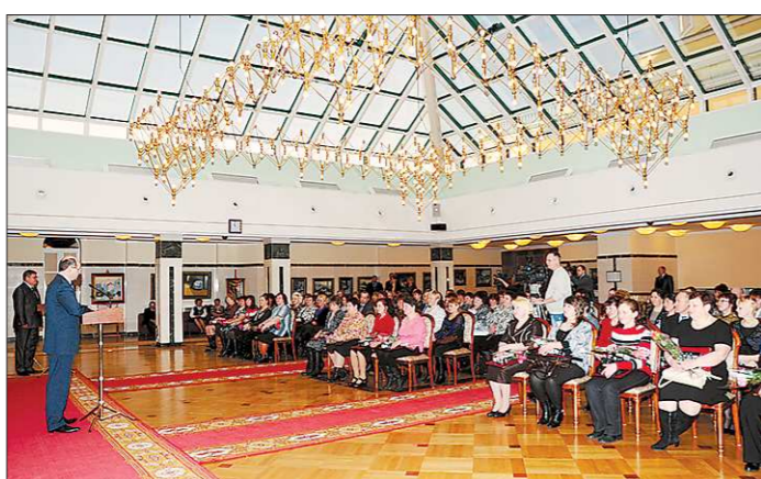
Доярки в резиденции губернатора. Но это не означает, что коровы остались недоены.

Вчера утром лучшие доярки области съехались в Екатеринбург, но это не значит, что коровы в хозяйствах остались недоены. Во-первых, есть вторая смена тоже очень хороших операторов машинного доения. Во-вторых, если учесть, что у многих работниц молочных ферм день начинается в пять утра, то они вполне могли бы успеть и на дойку, и в резиденцию главы региона за почётными грамотами.