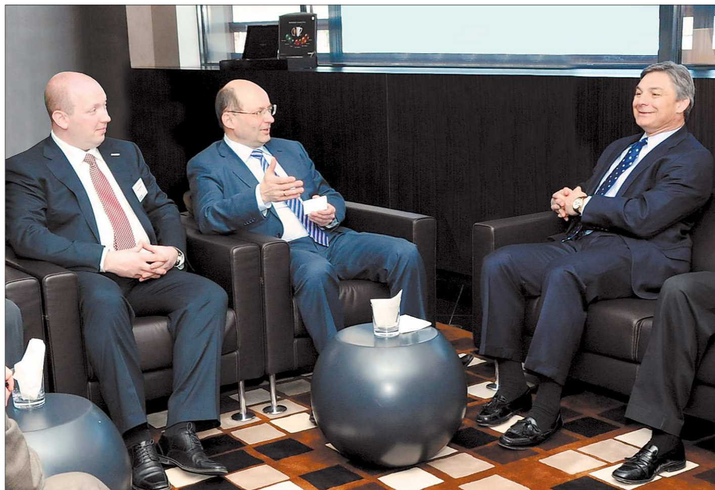
Встреча губернатора Свердловской области с представителями компаний «Боинг».