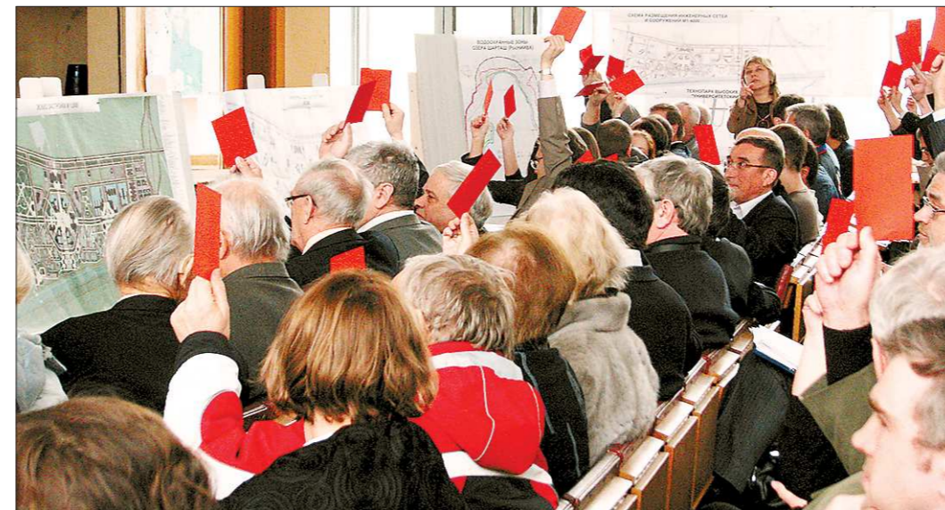
Большинство голосовало «за».

Как известно, район озера Шарташ рассматривался в качестве стройплощадки ещё при планировании создания Большого евразийского университета. Площадку под новые учебные и научные корпуса УрФУ оставили ту же, в юго-восточной части озера. Однако, прежде чем начать строительство, природоохранное законодательство требует получить на это согласие со стороны местных жителей. То есть провести общественные слушания. Что и было сделано. Первым перед собравши-