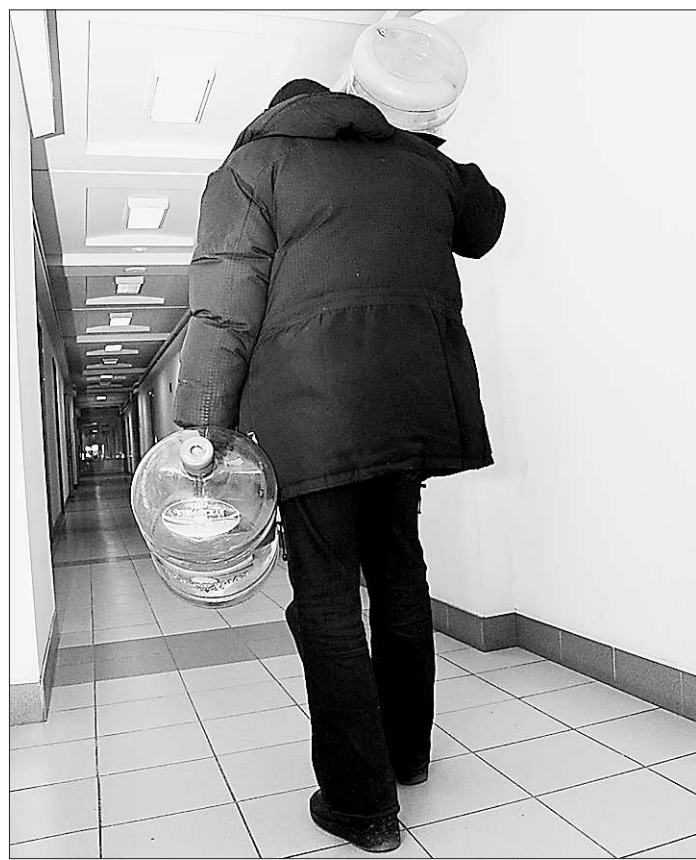
Бутилированная вода предпочтительнее, хотя во много раз дороже.

Водоснабжение областного центра производится из Волчихинского и Верхне-Макаровского водохранилищ, расположенных на реке Чусовой. В периоды засухи дополнительный водозабор производится из Верх-Исетского пруда, ряда других водоёмов и из Назепетровского водохранилища, что находится на реке Уфе. У нас подряд три года были безводные. Из реки Уфы в Свердловскую область переброшено уже более 130 миллионов кубометров воды, а это – дополнительные затраты на оборудование и электроэнергию. И не известно, какие сюрпризы принесёт предстоящее лето.