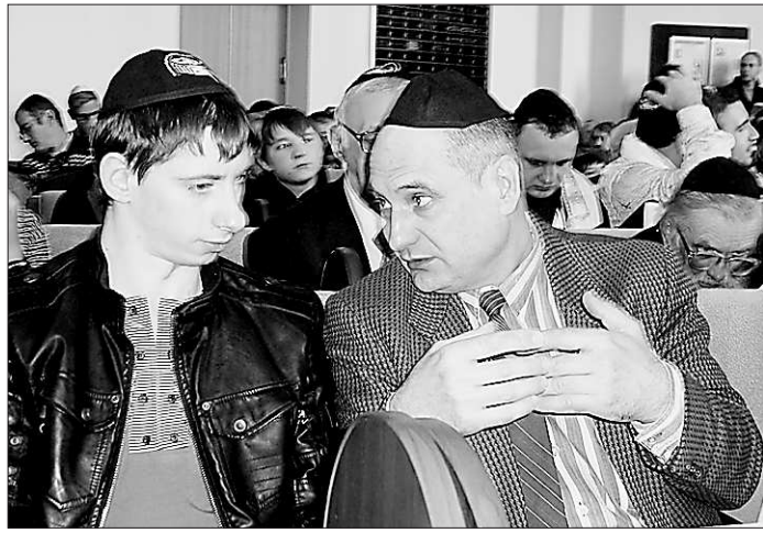
Праздник Пурим – молитва и общение.