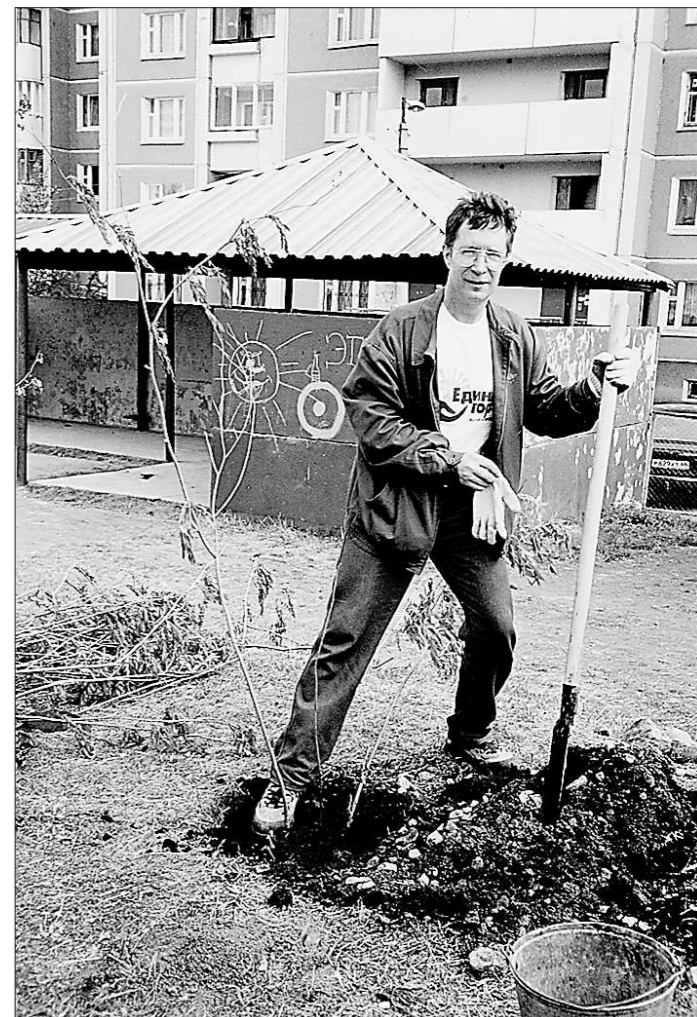
Посадить дерево – это свято!

К сожалению, доверие к «зелёному» движению в последнее время сильно подорвалось. Меньше внимания стало уделять ему и государство. Взять ВООП. Раньше оно пусть скромно, но финансировалось. Мы могли проводить различные экологические мероприятия, вели работу с юннатами. У общества был свой «Дом природы». Сейчас это в прошлом. Денег нет ни на аренду помещений, ни на что. Естественно, замедлилась и работа. Хотя некоторые мероприятия мы всё же проводим, чаще всего привлекая для этого сотрудников парка. ВООП и «Оленьи ручьи» могли бы быть очень полезными друг другу партнёрами. Потому и не снимаю с себя полномочий председателя ВООП, продолжаю работать, хотя не получаю за это ни копейки. Как ни странно, опять же верю в будущее, в то, что когда-нибудь ВООП возродится. Кстати, в недавнем прошлом – это была самая массовая экологическая организация в России.