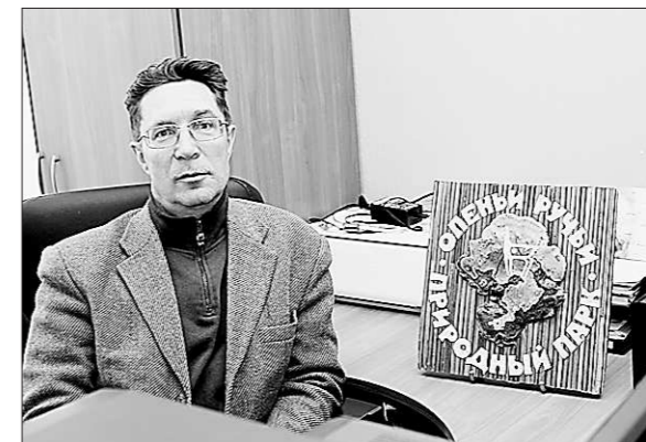
В своём рабочем кабинете.

– Может быть. Но если не верить, то как жить? Мне кажется, как раз благодаря созданию парков, заповедников и других ООПТ – особо охраняемых природных территорий – и можно остановить гибель природы. И то, что они создаются, большое дело. Парков много не бывает. Кстати, за последние полтора десятилетия на Среднем Урале в сфере охраны природы произошёл, можно сказать, настоящий прорыв: восстановлен заповедник «Денежкин Камень», Висимский заповедник приобрёл статус биосферного, созданы национальный парк «Припышминские боры», природные парки «Оленьи ручьи», «Река Чусовая», «Бажовские места». На очереди создание ещё нескольких парков – «Истоки Исети», «Ивдельский», «Уфимское плато».