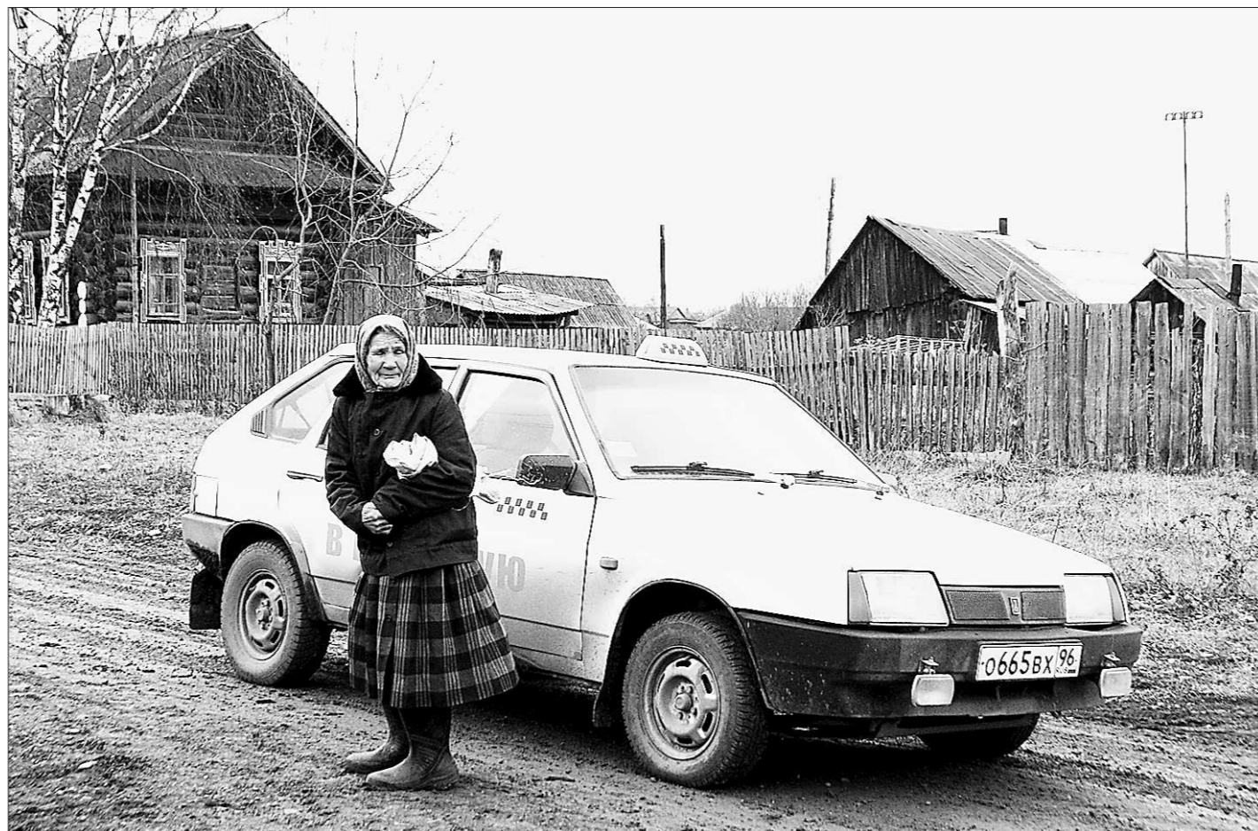
Мне в райцентр, сынок...