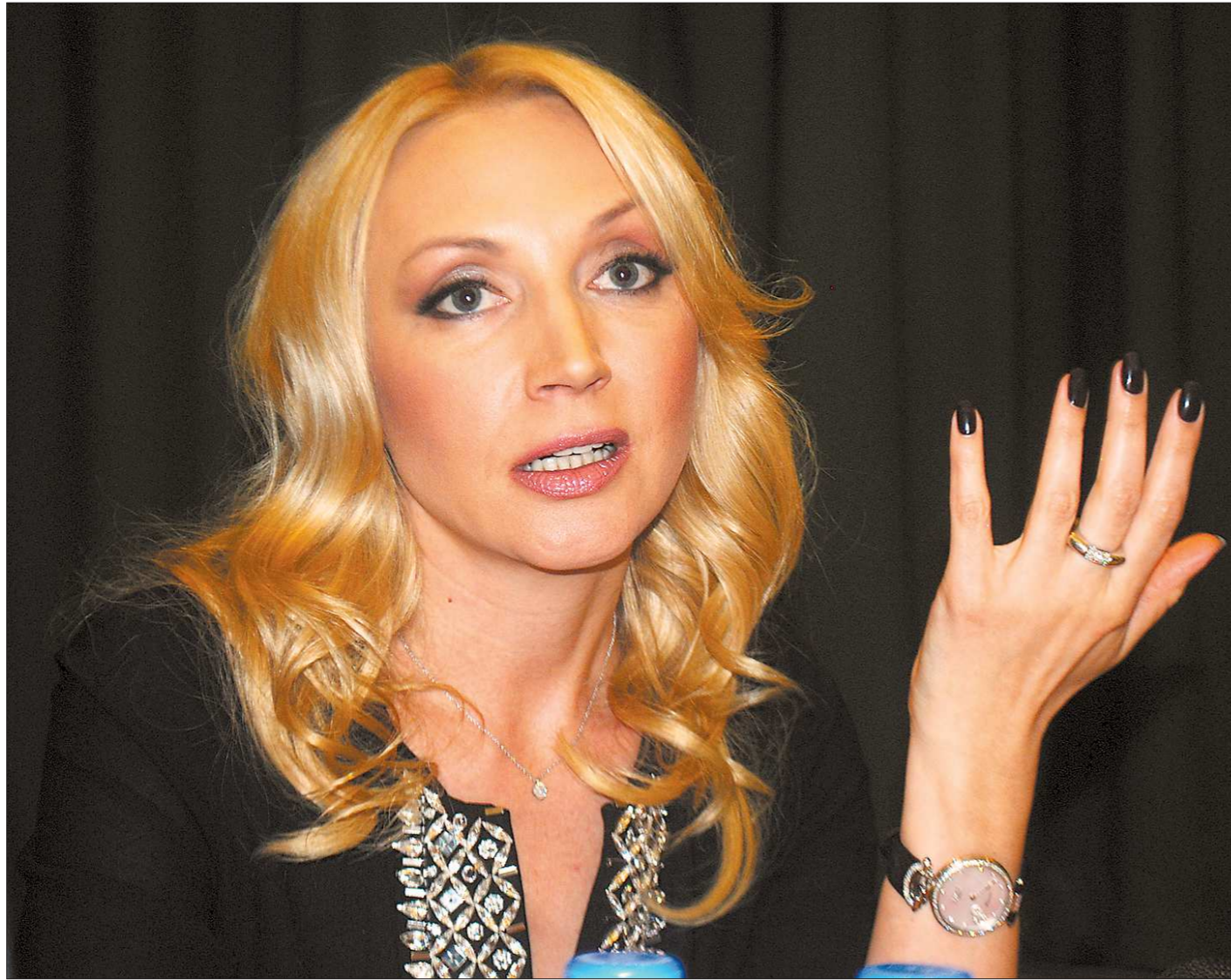
Кристина Орбакайте: «Я надеюсь, судьба преподнесёт мне ещё интересные драматические роли».

Кристина: - Четвертой серии точно не будет. У кассового проекта должно быть логическое завершение. Детство, отрочество, юность (то есть три «Любовь-Моркови») - трилогия, в которой я увидела логику. Когда я раздумывала, снимать или нет, мне сказали: «Может «похоронить» твою героиню на пятой минуте. Но я не хотела такой судьбы для Марины Голубевой и потому согласилась. Люди, которые не очень знают мое кинотворчество, наверняка думают, что кроме «Любовь-Морков» ничего не существовало, что взяли певцу, и она снимается в комедии. Этакая клоунасса. Я надеюсь, судьба преподнесет мне ещё интересные драматические роли. - Как удалось привлечь