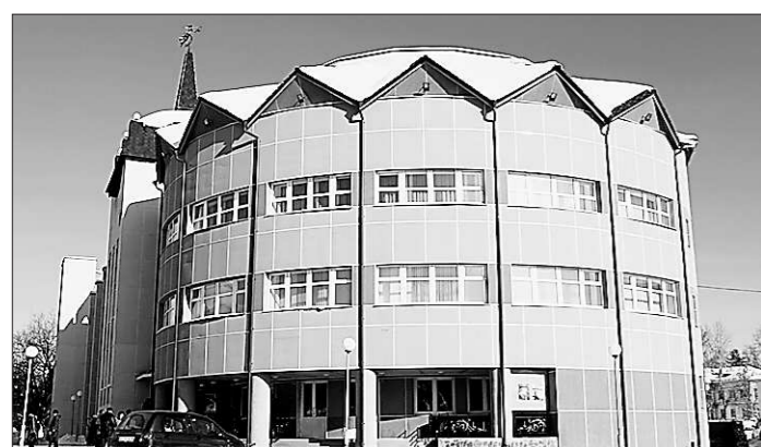
Здание новой школы обладает хорошей акустикой.