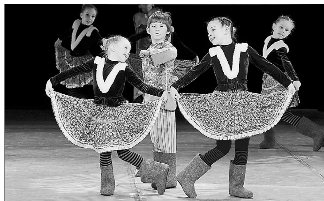
Кадриль – в валенках!

В этом году более 30 стран-участников продемонстрировали мастерство в классическом, современном, народном и эстрадном танцах. В Германии от «Улыбки» были дети 7-9 лет. На суд жюри представили три хореографические постановки в номинации «Народный танец»: «Кадриль»,