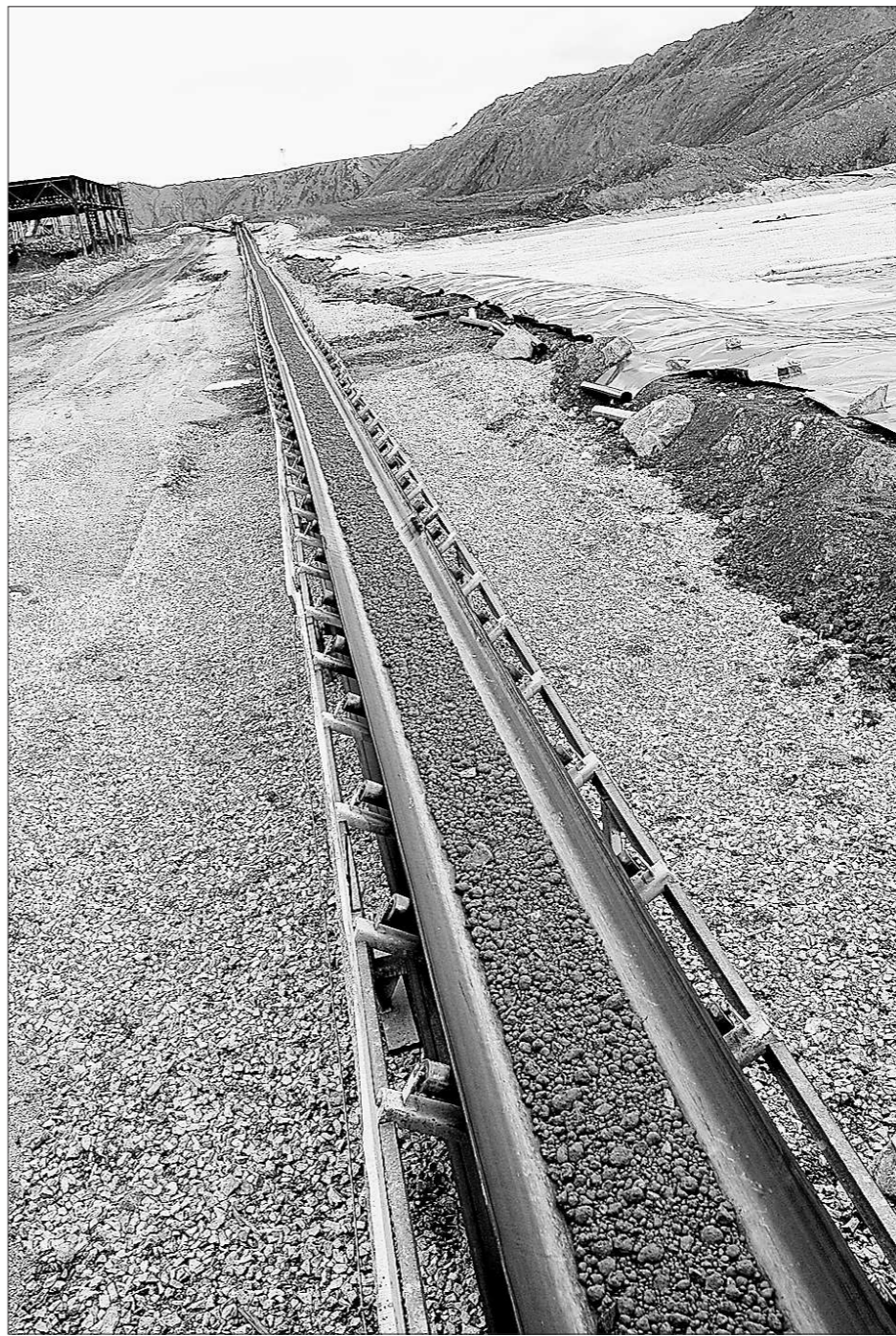
Новые технологии извлечения золота из руды требуют тщательно подготовленных площадок.

К следующему съезду золотопромышленники думают приблизить годовую добычу золота к двадцати тоннам.