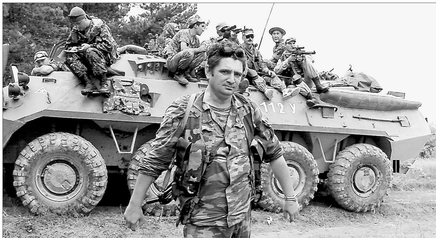
Возвращение с этапа разминирования.

Из наградного листа: «При следовании воинского эшелона по перерыву Буйнакск-Шамхал был произведён подрыв двух взрывных устройств