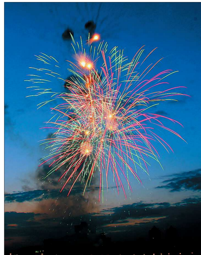
Огни салюта.

Но ежегодно в феврале и в мае батарея временно перевооружается с современных миномётных комплексов на 76-миллиметровые пушки ЗиС-3 времён Великой Отечественной войны и многоствольные салютные установки. Ведь после того, как Президент России своим Указом включил Екатеринбург в число городов, в которых ежегодно 23 февраля и 9 мая военному ведомству предписано проводить праздничный фейерверк, министр обороны издал приказ о на-