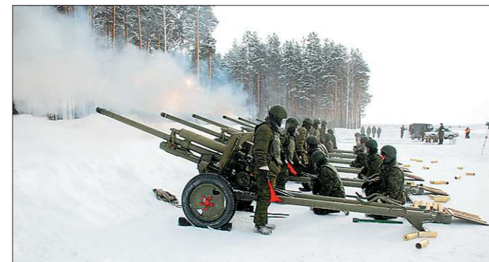
Артиллеристы готовятся к празднику.

Кроме стрельбы, на тренировках артиллеристы и во-