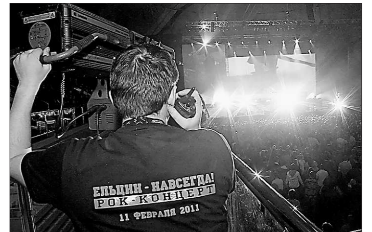
Рок памяти Президента.

«Всё это требует устранения и технического дооснащения, — жёстко заметил губернатор. — И это мы будем делать в рамках специальной программы по усилению безопасности на транспортных объектах. Будем для этого корректировать бюджет. Потому что на безопасности не экономят. Слишком дорого обходится такая экономия...»