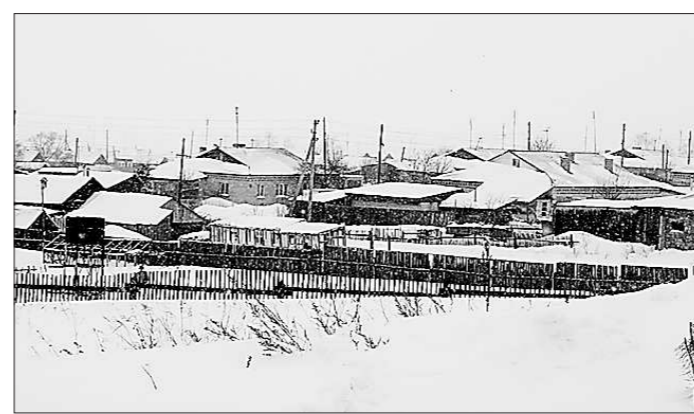
Село Кисловское.