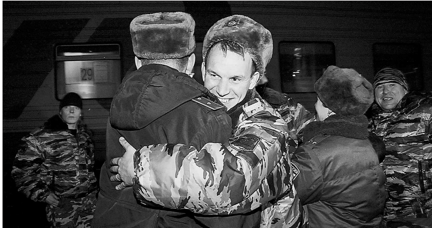
Командировка позади...

Сейчас вернувшиеся милиционеры находятся в реабилитационном отпуске.