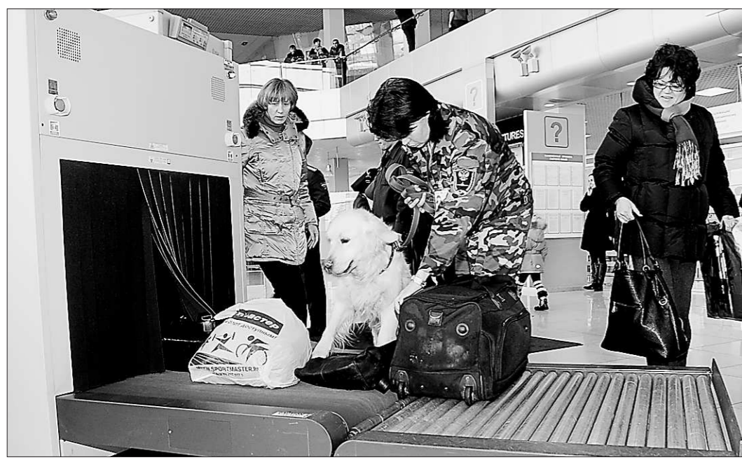
Собака сделала стойку на подозрительный багаж.