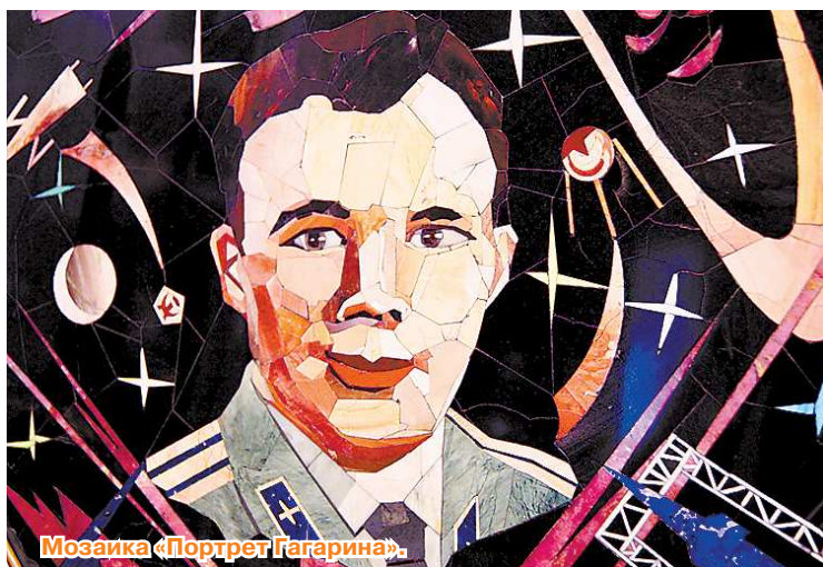
Мозаика «Портрет Гагарина».