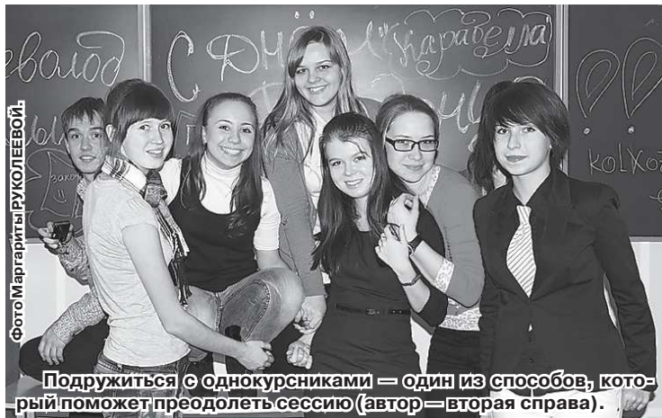
Подружиться с однокурсниками — один из способов, который поможет преодолеть сессию (автор — вторая справа).

Если честно, у меня не было чувства страха: не так страшна сессия, как её малюют. И сейчас мне как новоиспечённой студентке хотелось бы дать пару советов всем абитуриентам. Прежде всего, важно выполнять все задания вовремя. Проучив-